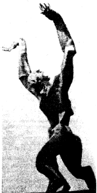
О. Цадкин. Памятник разрушенного Роттердама. 1953

много, очень много; хороших куда меньше, подлинно великих единицы. Среди них "Разрушенный город" Осипа Цадкина (1890-1967), признанный повсеместно - наряду с "Герникой" Пикассо - самым потрясающим произведением в память о трагедии войны. 14 мая 1940г. нацистская авиация уничтожила центр голландского порта, разрушив 11 тысяч домов, под развалинами которых погибли десятки тысяч мирных жителей. В 1953 году на набережной Левенхавен в Роттердаме был открыт памятник. "Человеческая фигура, - писал автор, - выражает ужас и бунт, поднимая руки к небу в страшном крике, который вырывается из ее смертельно раненного, разрушенного тела. Памятник хочет вместить нечеловеческую боль, которая покарала город. Крик ужаса перед чудовищной жестокостью палачей, задуманный, что-