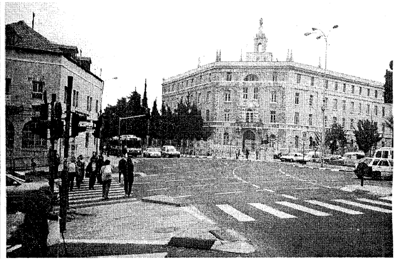
Иерусалим. 1998 г.

Уповаете, говорите, на демократию. Опять красивое слово - на этот раз из древнегреческого лексикона. На русском языке оно, кстати, означает - народовластие. Да-да, того самого народа, что от Томска до Одессы весьма оперативно сколачивает летучие отряды погромщиков. Говорите, нельзя обобщать, во всем виноваты подстрекатели сверху и отбросы общества снизу. Отбросов-то что-то довольно много. Да и медики утверждают, что отбросы тоже характеризуют выделяющий их организм. И ваши мудреные слова “массовый психоз”, “линия наименьшего сопротивления”, “поиски контрреволюции” ничего не объясняют. Надо сказать проще - “на-