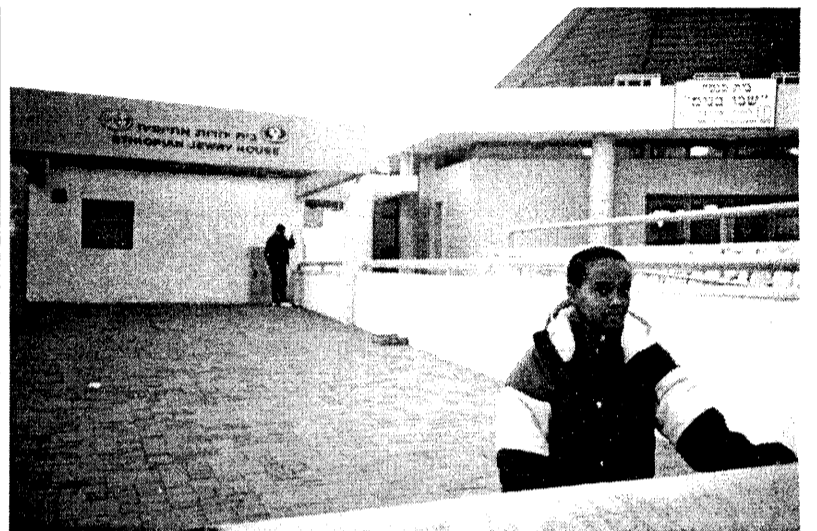
Общинный центр фалашиев. Беэр-Шева. 1998 г.

Конечно, так приятно и заманчиво вообразить, что за истекшие полвека под мудрым руководством Конрада Аденауэра, Вилли Брандта и Гельмута Коля немецкий народ наконец изжил тысячелетний антиеврейский психоз. В последние годы немало евреев из бывшего СССР, рисуя в своем