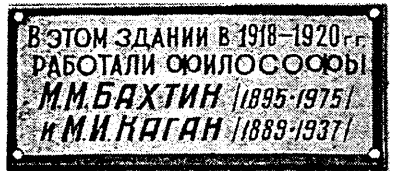
Мемориальная доска на здании бывшей Невельской единой трудовой школы. Открыта 27 сентября 1995 г.