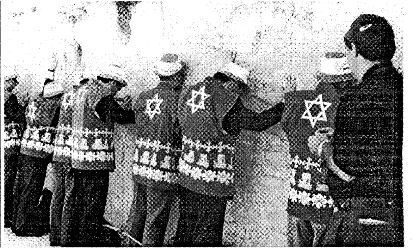
Иерусалим 1998. Китайские евреи у Стены Плача.