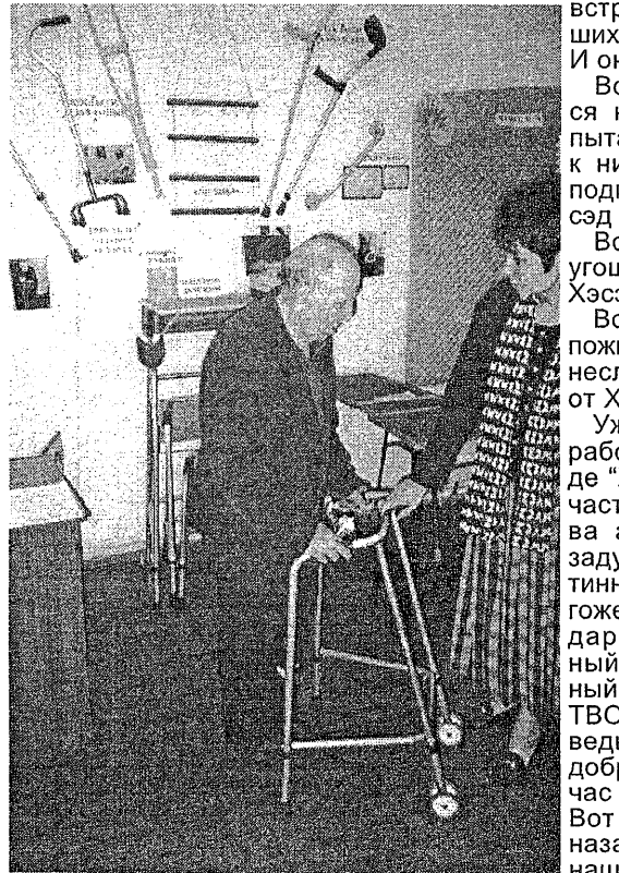
Прокат медицинского оборудования

- Простите, как вас зовут? - Это не имеет значения. Вы знаете, мы с друзьями не только ощутили свои корни, но и почувствовали наше большое брат-