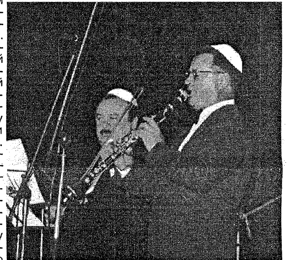
На концерте в СКК

- Простите, как вас зовут? - Это не имеет значения. Вы знаете, мы с друзьями не только ощутили свои корни, но и почувствовали наше большое брат-