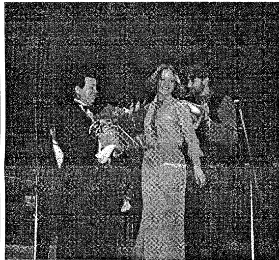
На концерте в СКК

Впечатляют итоги работы Хэсэда за прошедший год - пятый год работы. В Центр обращались 32308 раз, 2192 человека получили постоянную помощь (еда на колесах, патронаж, ежемесячные