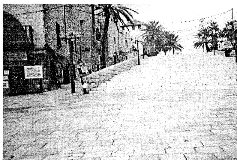
Яффо 1998 год.

Евреи в несоизмеримо большем процентном соотношении от общей своей численности вовлечены в битвы за то, что, по их мнению, считается справедливостью. В конце прошлого века 26 процентов всех арестованных за революционную деятельность в царской России были евреями, хотя на тот период они составляли всего лишь 3 процента всего населения огромной Российской империи. В борьбе за права негров в Америке опять-таки участвовало несоизмеримо большее число евреев, причем участвовали они не только лично, но и давали на эту борьбу крупные деньги. Любое движение, ставящее своей целью сражение за будто бы гуманные и добрые дела (в защиту прав женщин, охраны окружающей среды, бездомных, больных СПИДом, против жестокого обращения с животными и т.п.), привлекает евреев, как магнит, хотя чаще всего руководствуются они эмоциями, нежели логикой и здравой оценкой возможных последствий. Евреи воюют на передовой в битвах, не имеющих никакого к ним отношения. Евреи в первых рядах и в тех схватках, которые, как оказывается впоследствии, несут зло и